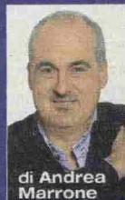
di Andrea Marrone

In libreria Paolo Grugni firma una grande testimonianza di un passato scomodo